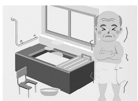
訪問入浴サービス ピンスが 所長 岡野真理子