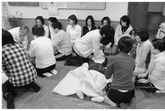
石田先生の講習会の様子

「AEDを実際に使ってみて、イザというときに冷静に対応できます。」と、自信のついた職員もいました。今後の訪問活動に役立つ充実した講習会となりました。