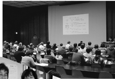
分科会発表の様子

1月20日(日)神戸国際会議場(ポートアイランド)において、兵庫民医連学術運動交流集会在開かれました。