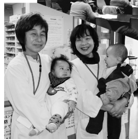
抱っこボランティア

1月20日(日)神戸国際会議場(ポートアイランド)において、兵庫民医連学術運動交流集会在開かれました。