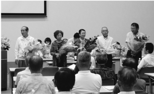
退任される皆さんご苦労様でした。