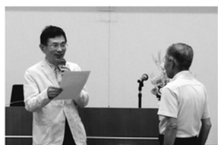
新田・中筋、神美、鶴城、朝来支部が表彰されました。