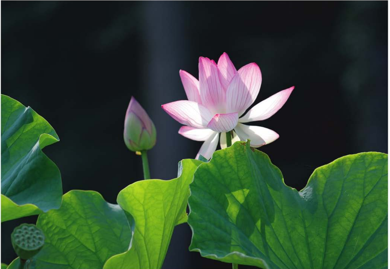
撮影地 香美町村岡区味取