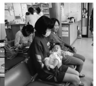
赤ちゃんを抱っこ!

5月26日(月)から5月30日(金)まで、トライやるウィークで4人の中学生が体験に来ました。初日から皆元気なあいさつができていましたし、まじめに取り組めていました。診療所では薬の準備や診察の見学を行いました。また、抱っこボランティアにも挑戦しました。介護事業所では訪問看護、訪問介護、訪問入浴に同行しました。日に日に成長する姿に、各所長も感心していました。