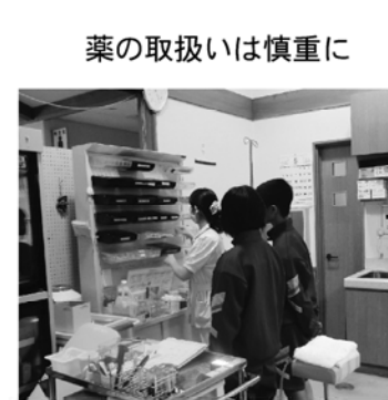
薬の取扱いは慎重に

をしていきます。要介護者や家族の意向を踏まえてケアプランを作成し、そのプランにそってサービスが行われていきます。主治医とも連携を図り、必要時にはサービス事業所とサービス担当者会議を開催し、より良い支援が行われるように話し合いを行います。また、要介護者の心身の状況や家族の事情の変化、適切なサービスや援助を受けているか、新たなニーズはないかなど変更・改善すべきところは、ないか常にチェックを行い、継続的に要介護者がより良い生活を送れるように支援を行