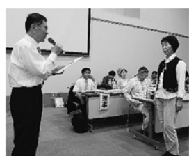
新田・中筋、神美、亀城、日高、やぶ支部とろっぽう診療所が表彰されました。