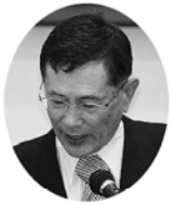
健康で人間らしく生きていくためには「平和」が大前提だ。それが、戦争法案によっておびやかされている。平和を保障してきた憲法がないがしろにされないためにも、平和を守る運動を強めていかなければならない。