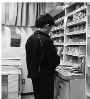
薬の準備のようす

6月1日(月)から6月5日(金)まで、2人の中学生が職場体験にきました。診療所や介護事業所で色々なことにチャレンジしました。2人とも積極的に取り組んでいました。