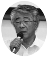
村岡峰男 (日本共産党 但馬地区 委員長)