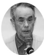
作 嶋 新代 中 嶋 総代

色々な取り組みを通じてお互い顔見知りになり、連帯感を持って活動できている。毎週1回行っているクラウンド・ゴルフ班会は、多い時で22人が参加した。年末のもちつき大会も続けており、独居老人宅へつきたての餅を配達し喜ばれている。