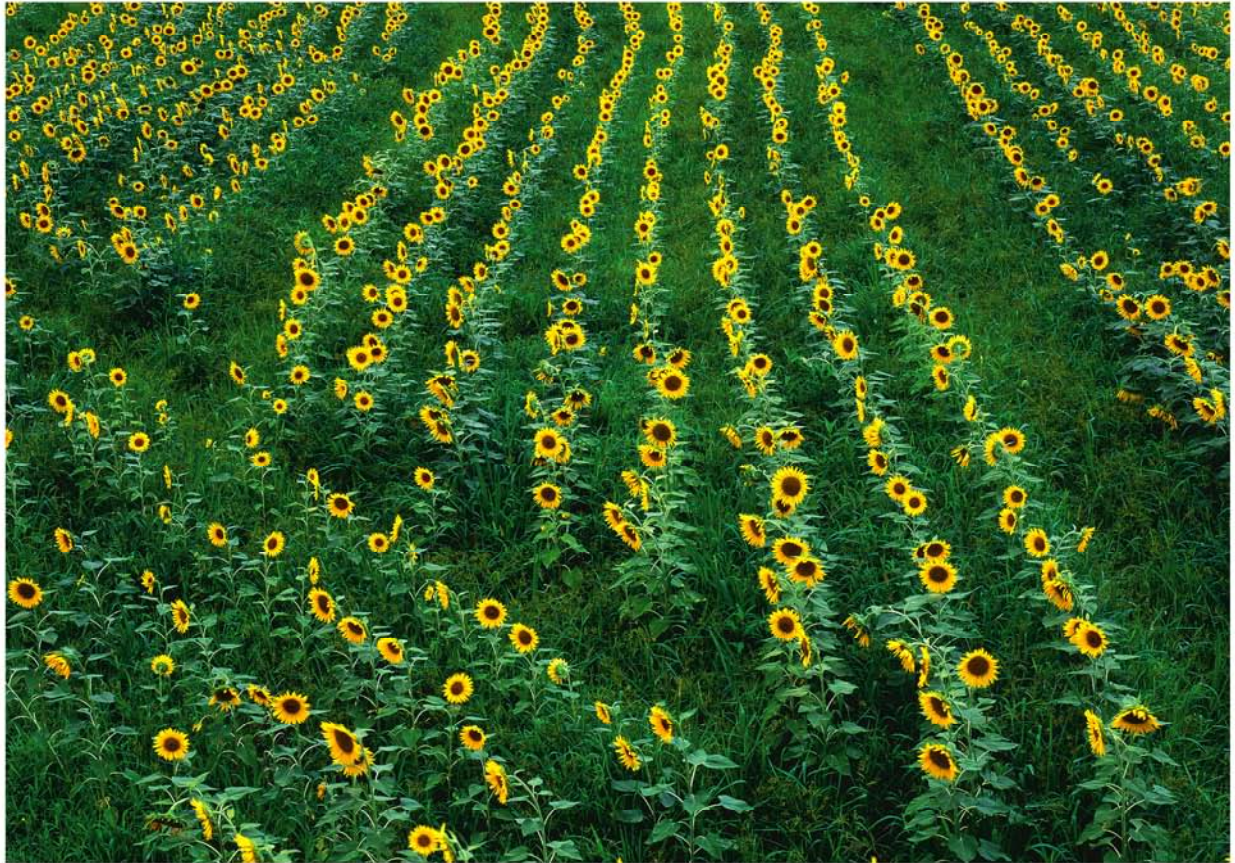
撮影地 南光町