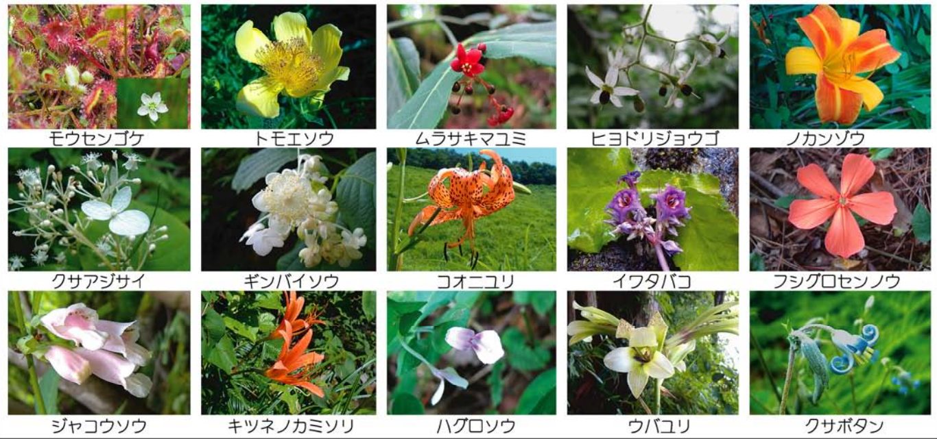
モウセンゴケ トモエソウ ムラサキマユミ ヒヨドリジョウゴ ノカンソウ クサアジサイ ギンバイソウ コオニユリ イフタバコ フシグロセンノウ ジャコウソウ キツネノカミソリ ハグロソウ ウバユリ クサポタン

生物は大きく動物、植物、菌類に分類されますが、皆様は動物を中心に考えていませんか？菌類は命を落とした動・植物を腐らせ、大地の栄養分にする大切な役割があります。また植物は動物に必要な酸素を作ってくれます。従って植物、菌類等自分で移動出来ない弱いものも、大切に思う気持ちが必要です。動物、植物、菌類全ての力により栄養のある土ができ、ミネラル豊富な水が生まれます。それにより森や川、海が豊かになり人間はその恩恵にあずかっています。山野草を自然のままに観察し愛でていると、健康で癒されるだけでなくこんな基本的なことも教えてくれます。