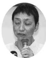
子 民 井 村 井 理事

住み慣れた地域で安心して暮らしたいという要望から助け合い活動「なんなっと」の発足を進めることにした。