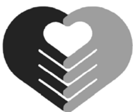
新しいマークです

今まで介護事業所の車には、虹のマークがついていました。2月から新しく3台加わりましたが、それらにはハートのマークがついています。日々訪問活動がんばっています。スタッフを見かけたらお声掛けくださいな。