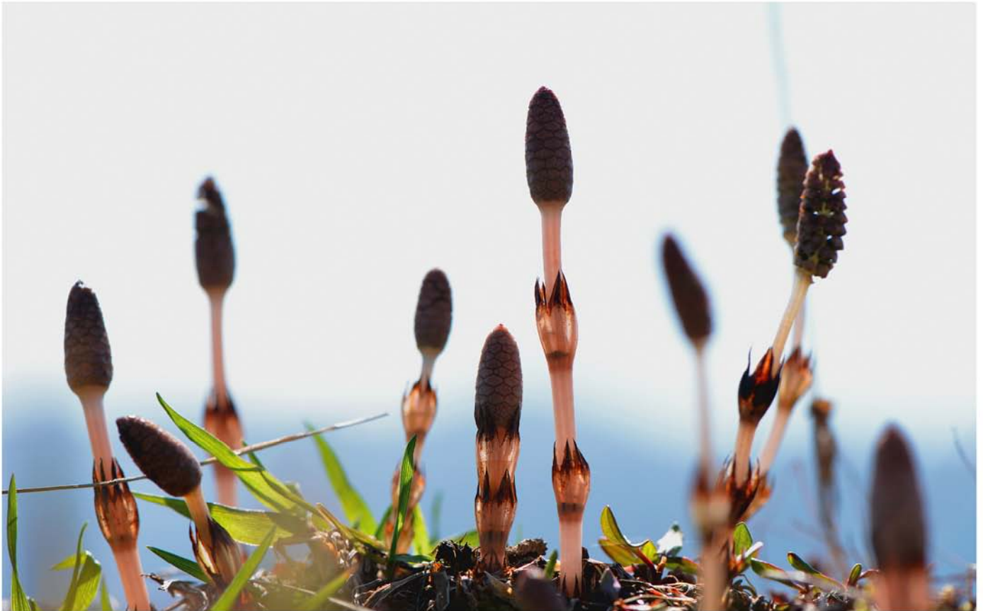
撮影地 兎和野