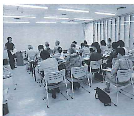
スキルアップ講座のようす

介護保険制度の改悪に伴い支援の必要な人が増えていきます。その要求に正しく応えていくためにも、支援者のための学習会が必要ではないかと考え、「スキルアップ講座」