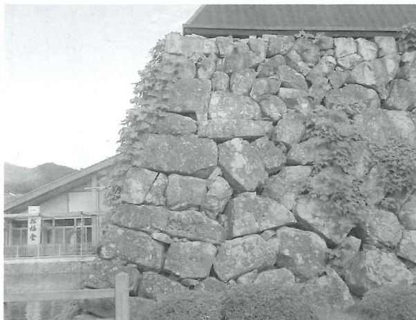
出石城三の丸大手

【Ⅱ期出石城（三の丸）】三の丸は、軸線だけでなく、広さも、縄張もⅠ期出石城と全く異なる。その縄張は、Ⅰ期出石城をその東西斜面に構築した大規模な豎堀、豎堀と連結した土塁とセットになった水堀・蓮池で取り囲んでいる構造である。更に、北・西・東に設けられた虎口（大手門・西門・東門）は、何れも防御性の高い枡形虎口となっている。しかし三の丸は総石垣ではなく大部分が土塁造りとなっており、虎口部分と3つの櫓台のみが石垣づくりである。石垣の積み方も算木積ではなく、少し退化した形となっている。残念なことに、大部分の三の丸は開発によって破壊されている。僅かに大手門、西門の一部、大手門から東側の内堀・土塁・石垣などが往時の姿を偲ばせるに過ぎない。因みに現在出石城のシンボルとなっている大手門の「辰鼓櫓」（時計台）は明治期につくられたもので、江戸期には存在しなかった。本来は「辰の刻」に太鼓によって時刻を告げた「太鼓櫓」なのである。