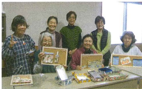
作品を手に、マスクも取って ハイチーズ!

今年は、2枚の布をポンドで張り合わせた「クラフト布」を使って小物を入れる箱やメモボードを作りました。「真心に込めて作って楽しかったね」「みんなと一緒に集まれて良かった」「また集まろうな」と皆さんの声。ひまわり作業所のおいしいシフォンケーキとコーヒーも頂きながら、楽しい半日を過ごしました。