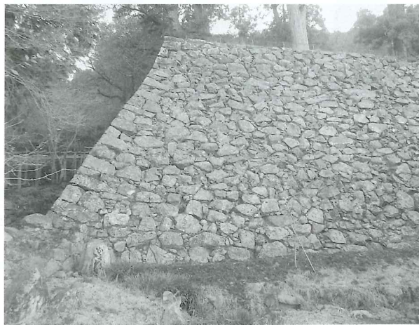
出石城稲荷曲輪石垣