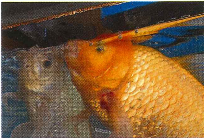
えさに食いつく金魚