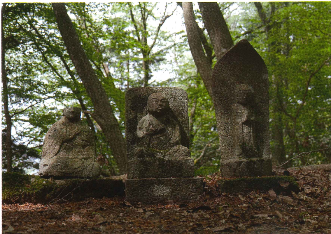
三開山にて