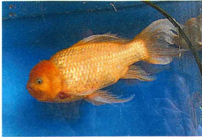
一番大きな金魚(約30cm)

2回取材に行つて計1時間お話を聞きしました。趣味というよりは生き甲斐のようで、ご夫婦で目を輝かせて金魚の話をしてくださいました。