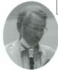
義 信代 野 総 西